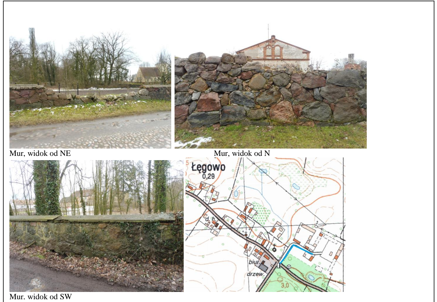
Mur, widok od NE

4. Adres Łęgowo (dz. nr ewid. 77/3, 142/2, 234, 143)