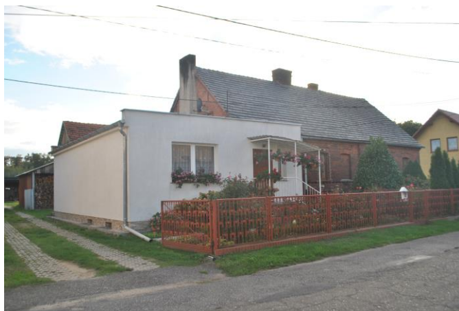
Dom, widok od NE