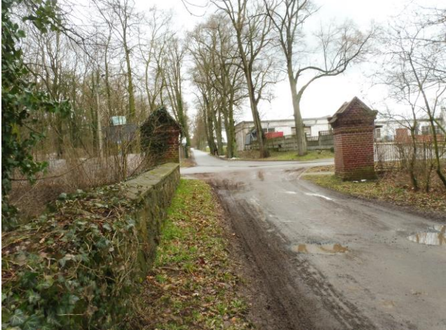
Mur, widok od N