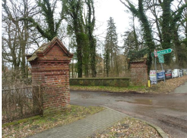
Mur, widok od SW