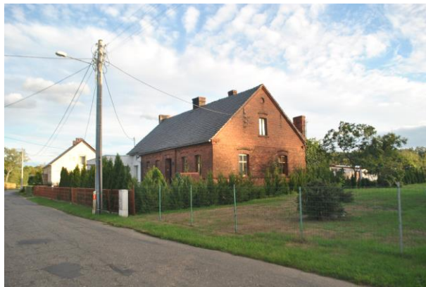
Dom, widok od NW