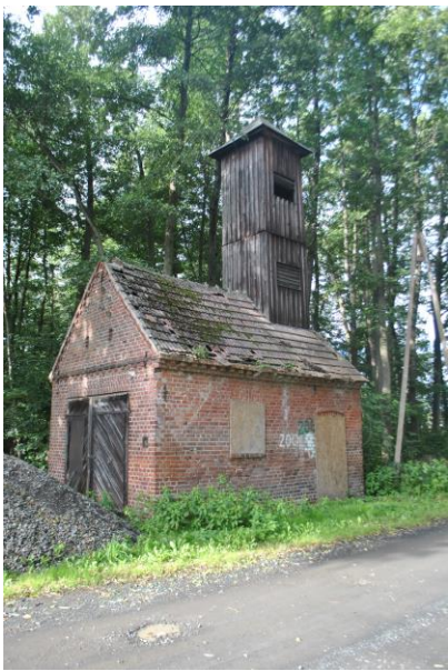
Remiza, widok od SE