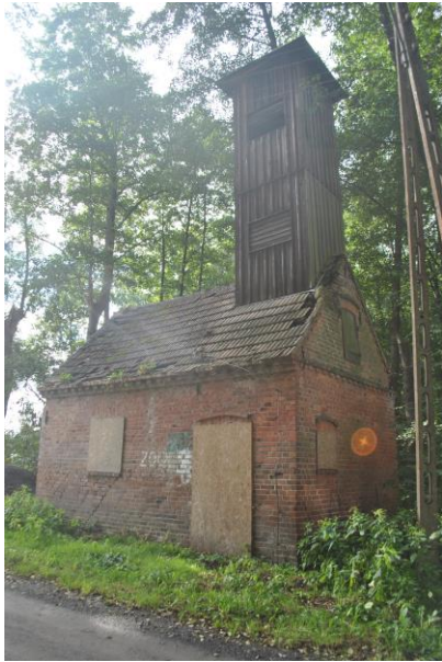
Remiza, widok od NE