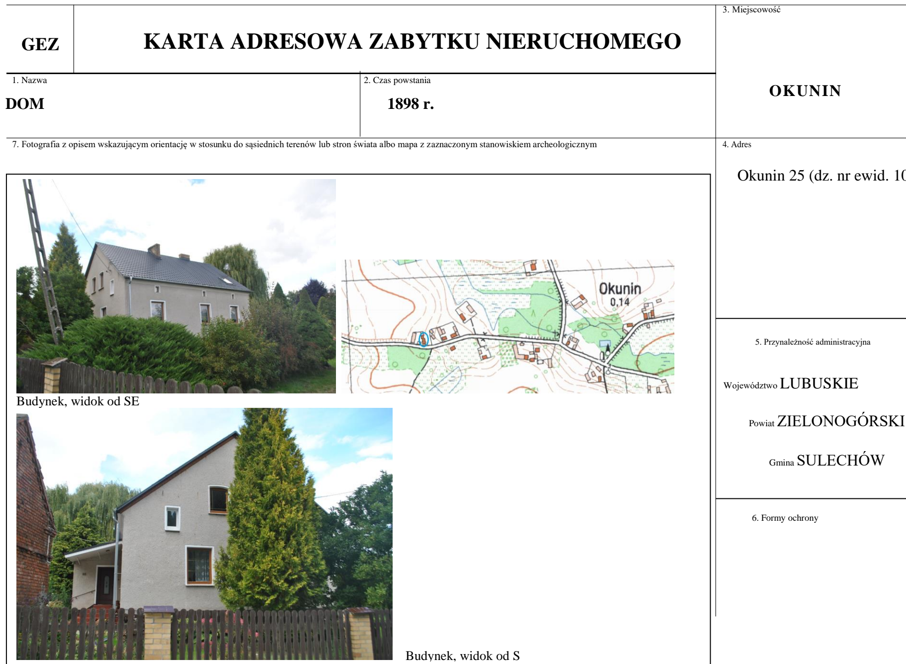
Budynek, widok od SE