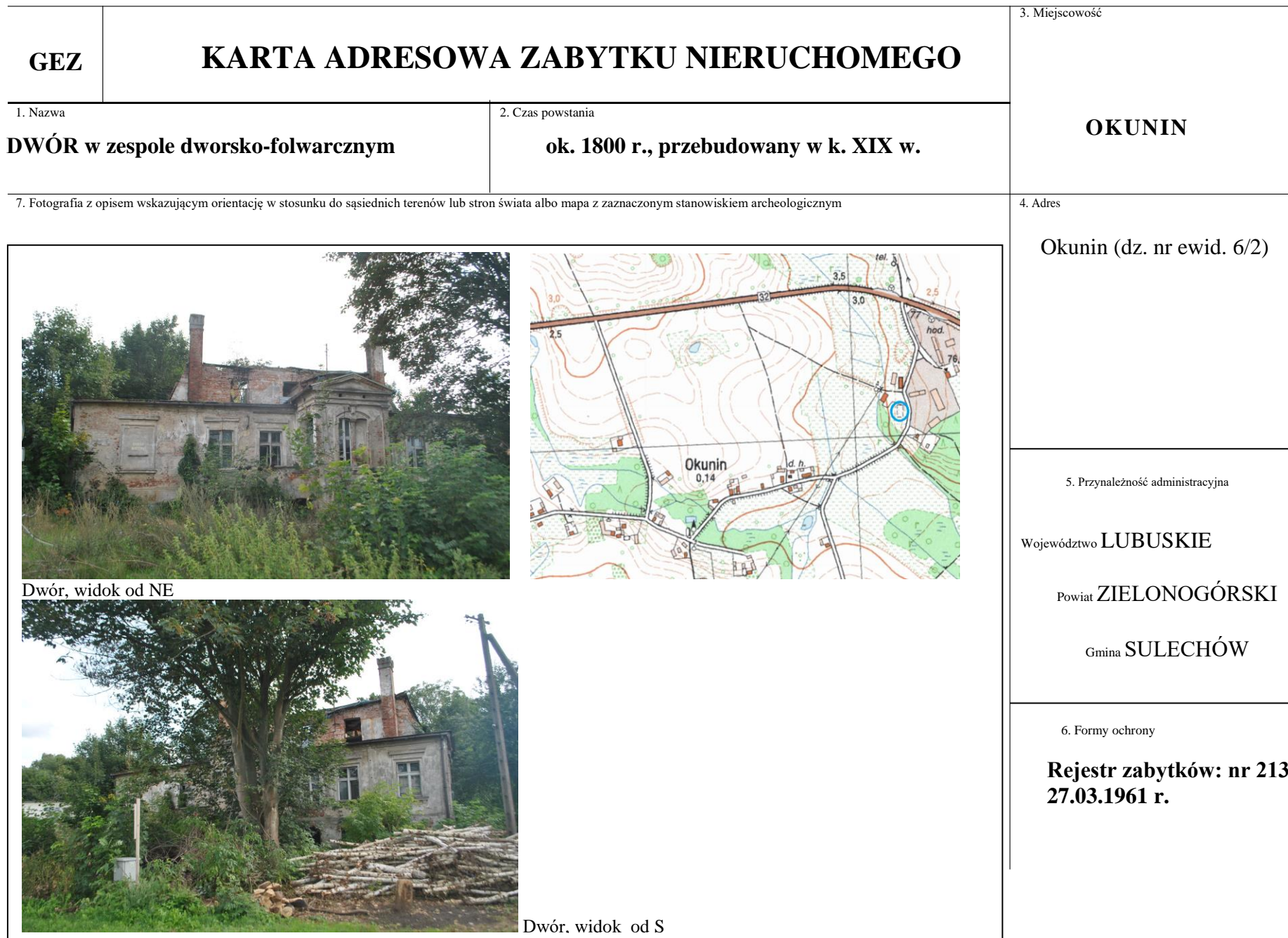
Dwór, widok od NE