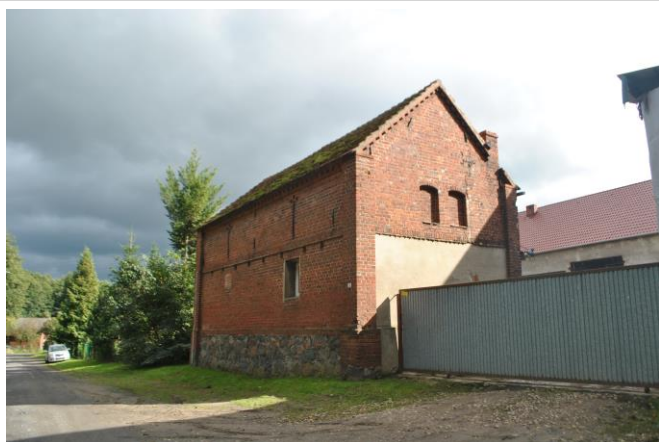
Budynek, widok od NW