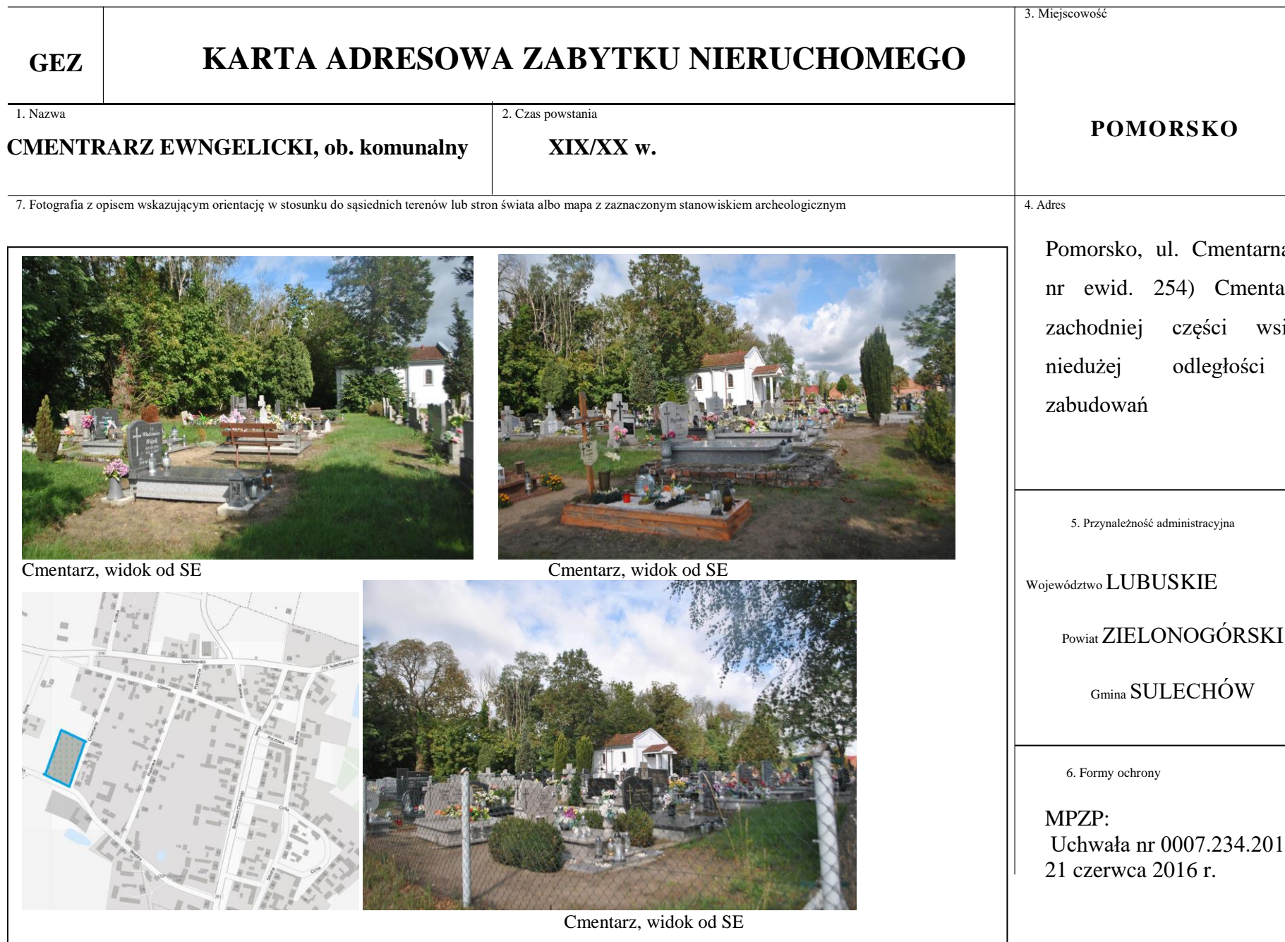
Cmentarz, widok od SE