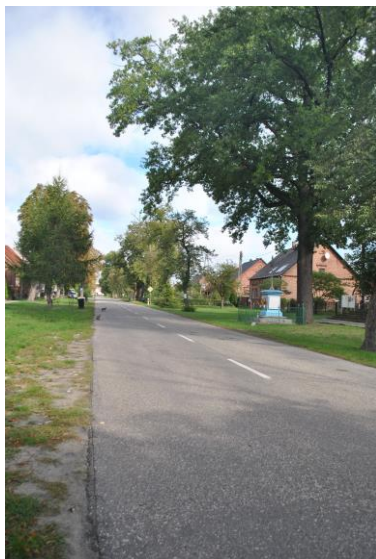
Aleja, widok od S