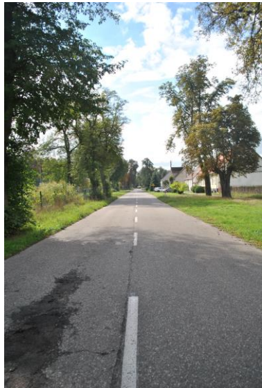
Aleja, widok od N

Pomorsko, ul. B. Chrobrego (dz. nr ewid. 611/1)