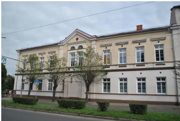
Szkoła, widok od W