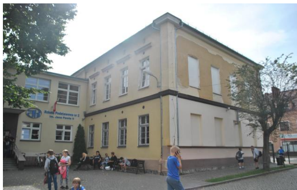
Szkoła, widok od NW