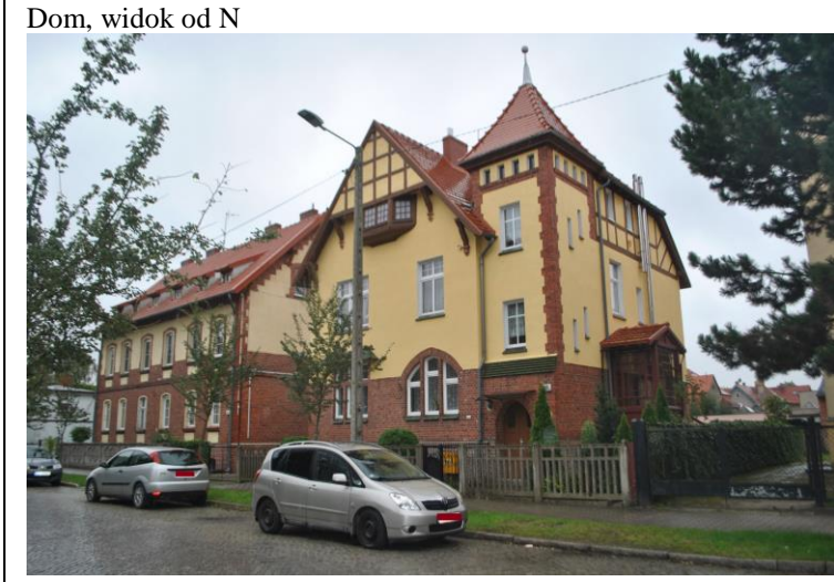
Dom, widok od N

5. Przynależność administracyjna Województwo LUBUSKIE Powiat ZIELONOGÓRSKI Gmina SULECHÓW