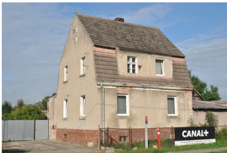
Dom, widok od SE

Położenie w granicach zespołu urbanistyczno-krajobrazowego miasta Sulechów wpisanego do rejestru zabytków pod nr 58 (decyzja z dn. 07.11.1995r.) i nr 2164 (decyzja z dn. 31.01.1975r.) MPZP Nr: XXI/198/2000