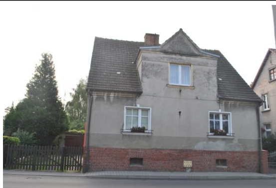
Dom, widok od W

Położenie w granicach zespołu urbanistyczno-krajobrazowego miasta Sulechów wpisanego do rejestru zabytków pod nr 58 (decyzja z dn. 07.11.1995r.) i nr 2164 (decyzja z dn. 31.01.1975r.)