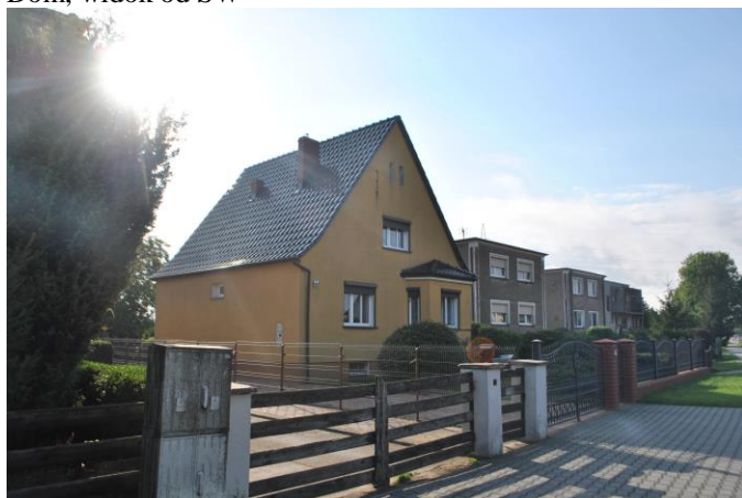
Dom, widok od NW