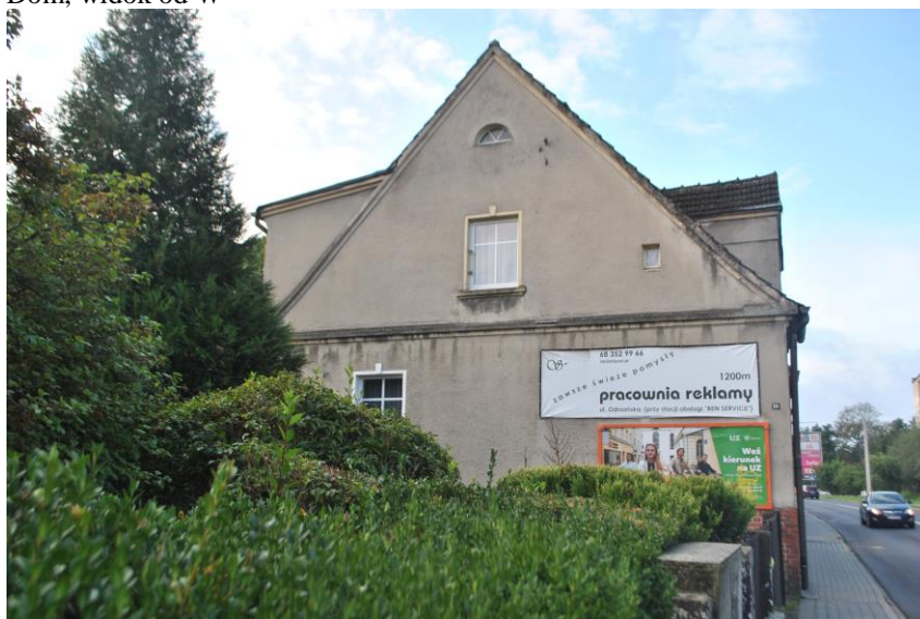
Dom, widok od N