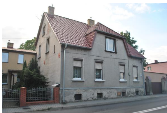
Dom, widok od NW

Położenie w granicach zespołu urbanistyczno-krajobrazowego miasta Sulechów wpisanego do rejestru zabytków pod nr 58 (decyzja z dn. 07.11.1995r.) i nr 2164 (decyzja z dn. 31.01.1975r.)