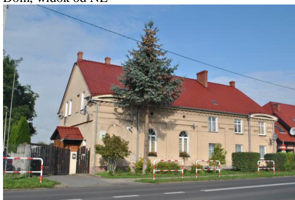
Dom, widok od SE