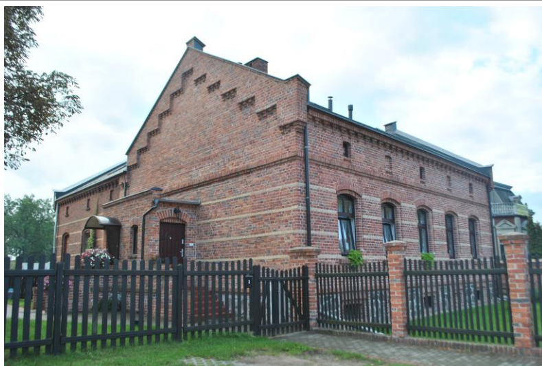
Dom, widok od NW

Położenie w granicach zespołu urbanistyczno-krajobrazowego miasta Sulechów wpisanego do rejestru zabytków pod nr 58 (decyzja z dn. 07.11.1995r.) i nr 2164 (decyzja z dn. 31.01.1975r.)