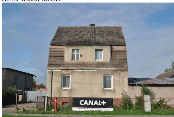
Dom, widok od E