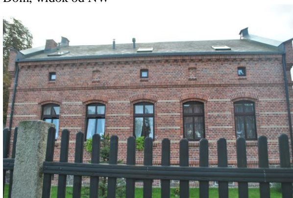
Dom, widok od W