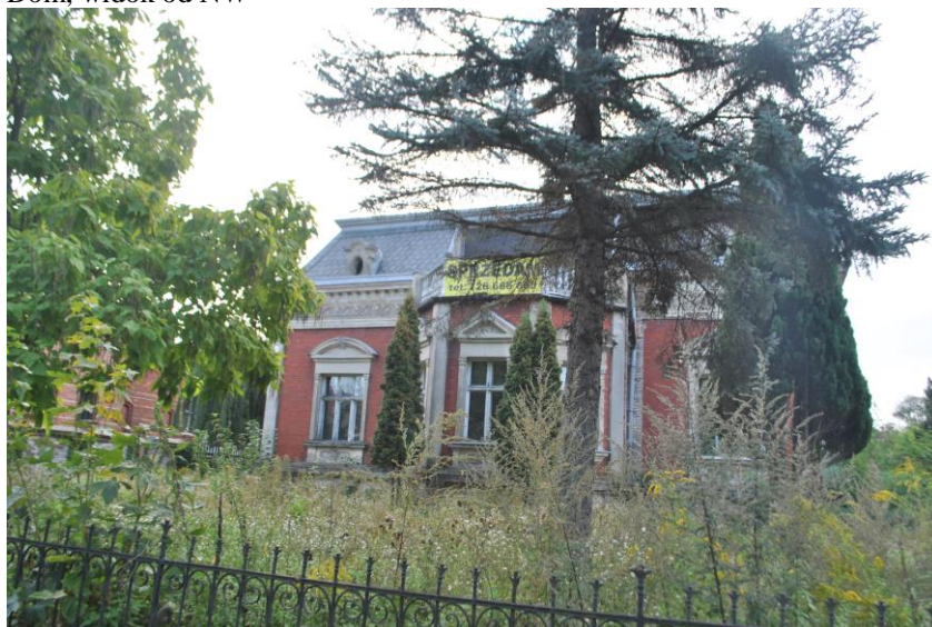
Dom, widok od W