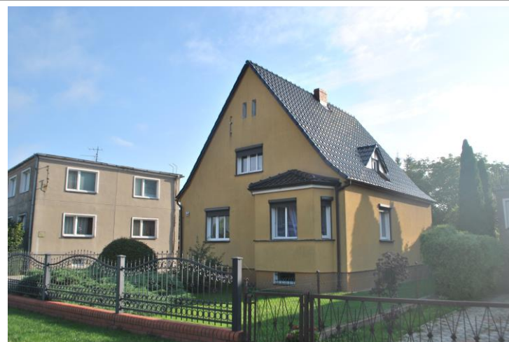
Dom, widok od SW

Sulechów, ul. Odrzańska 30 (dz. nr ewid. 1006)