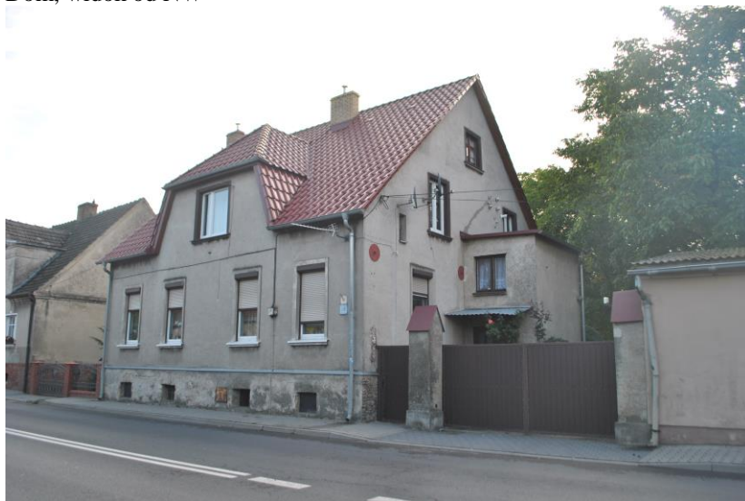
Dom, widok od SW