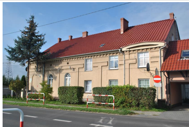
Dom, widok od NE

Sulechów, ul. Odrzańska 49 (dz. nr ewid. 911)