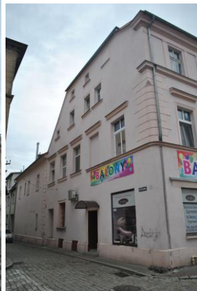
Dom, widok od NW