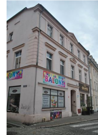
Dom, widok od NW