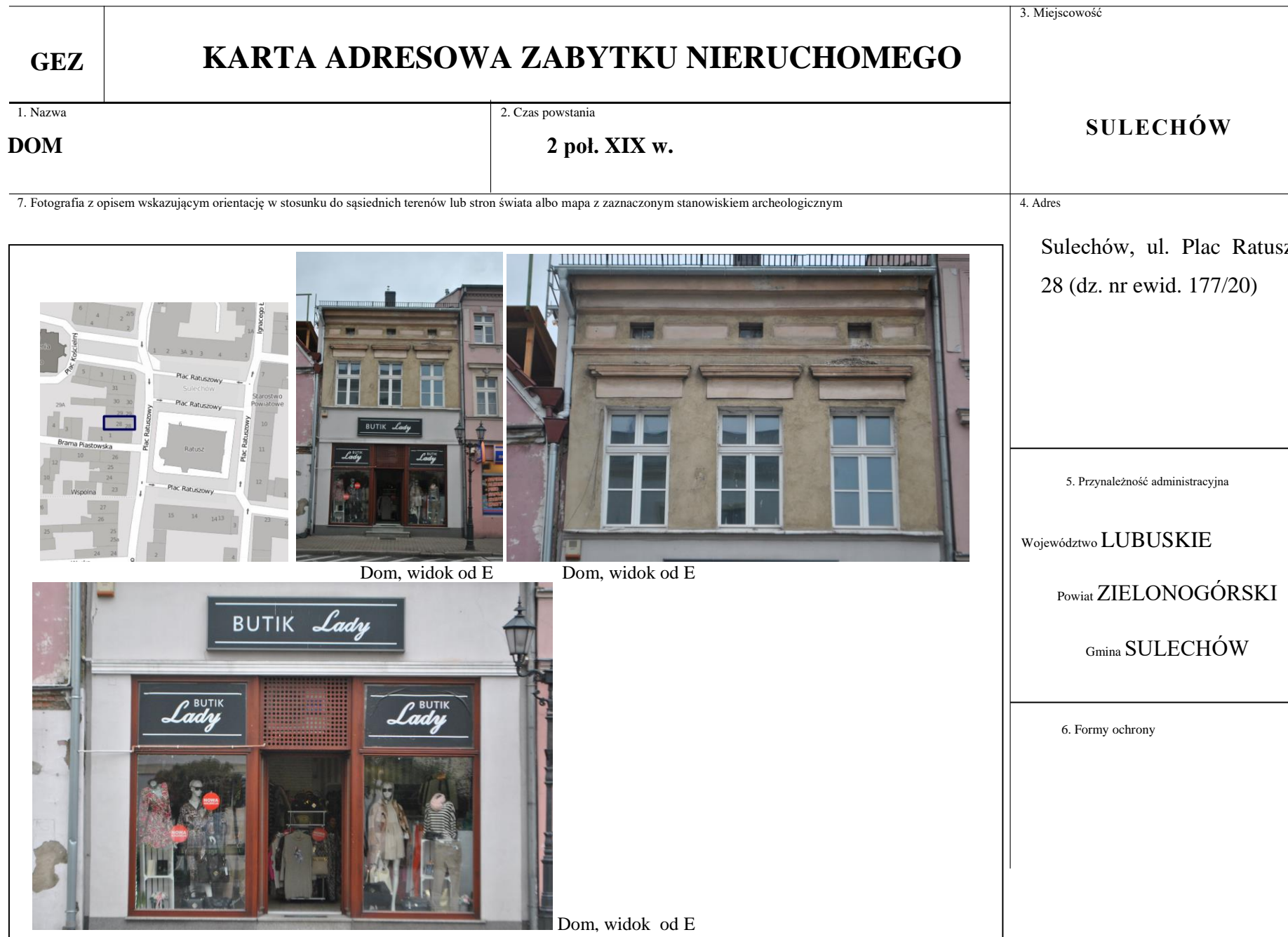
Dom, widok od E