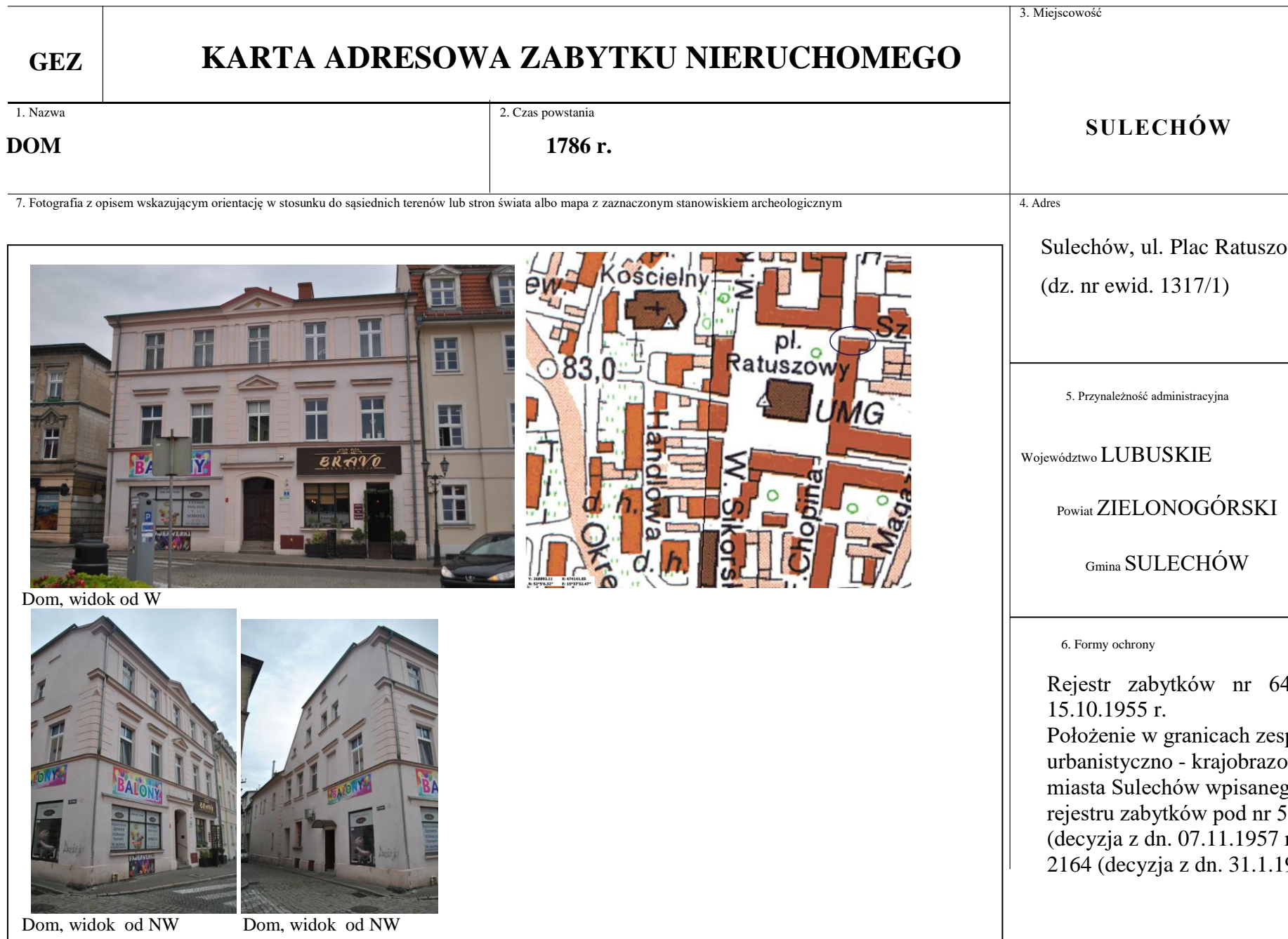
Dom, widok od W