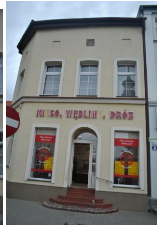
Dom, widok od S

6. Formy ochrony Rejestr zabytków nr 2164 z 31.01.1975 r. Położenie w granicach zespołu urbanistyczno - krajobrazowego miasta Sulechów wpisanego do rejestru zabytków pod nr 58 (decyzja z dn. 07.11.1957 r.) i nr 2164 (decyzja z dn. 31.1.1975 r.)