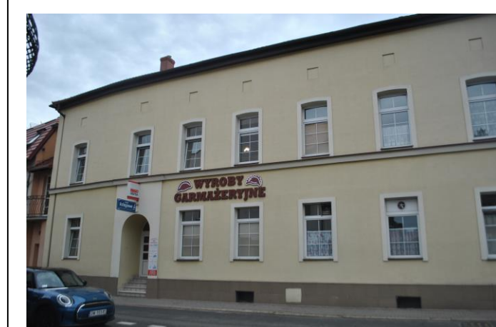
Dom, widok od W