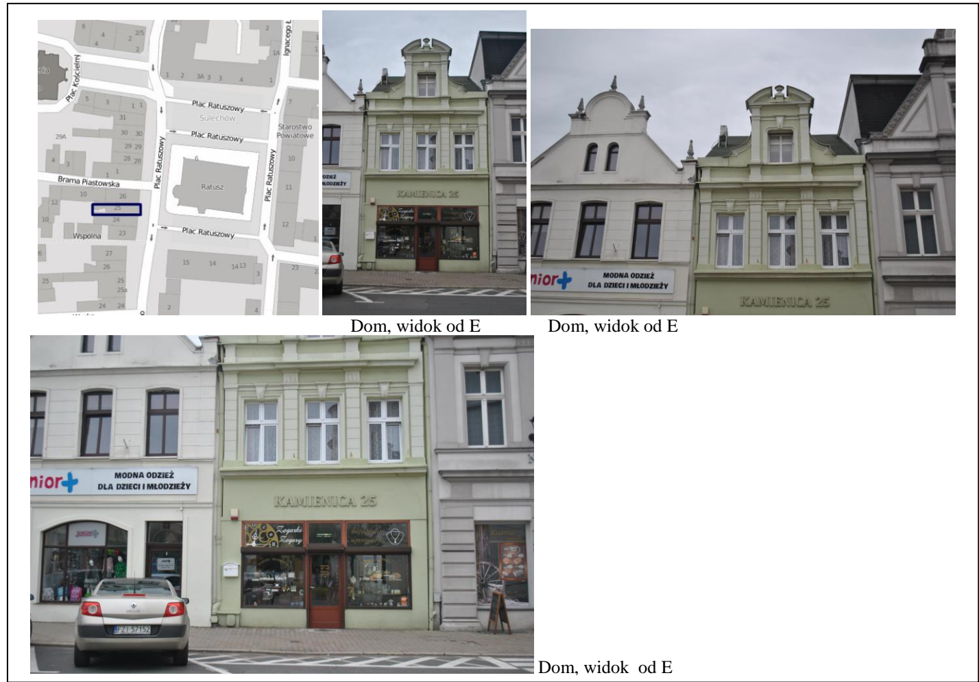
Dom, widok od E

Sulechów, ul. Plac Ratuszowy 25 (dz. nr ewid. 169/5)