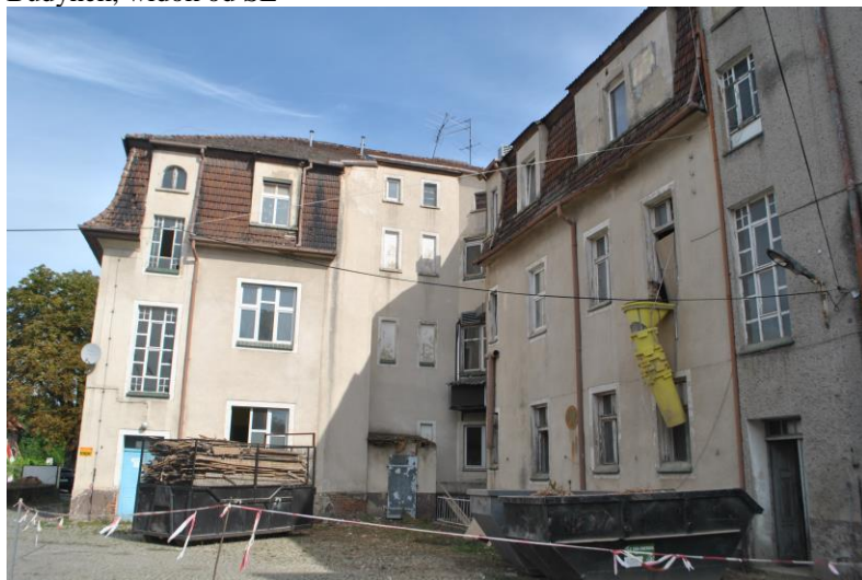
Dom, widok od SW