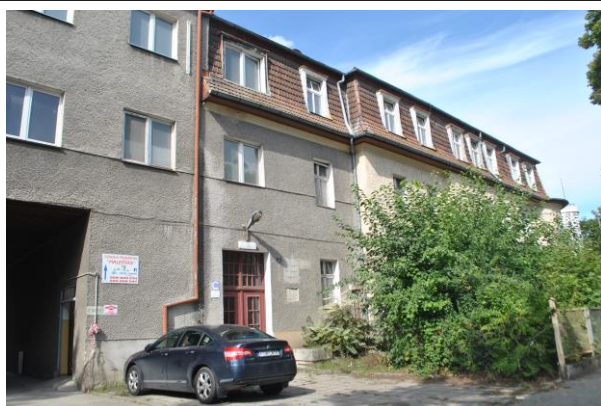
Budynek, widok od SE

Położenie w granicach zespołu urbanistyczno-krajobrazowego miasta Sulechów wpisanego do rejestru zabytków pod nr 58 (decyzja z dn. 07.11.19957r.) i nr 2164 (decyzja z dn. 31.01.1975r.)