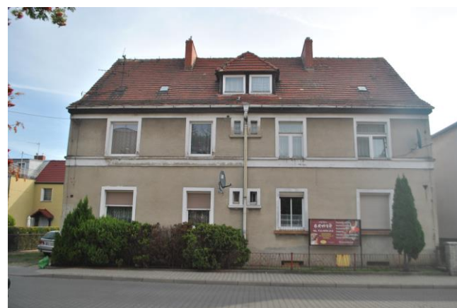
Dom, widok od W

Sulechów, ul. Lipowa 8 (dz. nr ewid. 489)